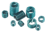
Volné náhradní závitové vložky